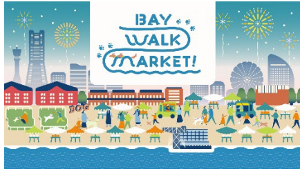
<イベントキービジュアル>

※横浜赤レンガ倉庫エリアの「ドッグラン」「ドッグマルシェ」は、10月6日(金)からオープン