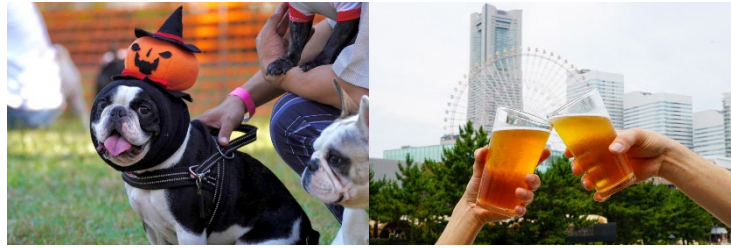
<会場イメージ ※過去開催の様子>

横浜みなとみらい新港地区の臨海部に面する横浜赤レンガ倉庫、MARINE & WALK YOKOHAMA、横浜ハンマーヘッド、DREAMDOOR YOKOHAMA HAMMERHEADの4施設を結び、横浜みなとみらい新港地区の水際プロムナードで、2023年10月7日(土)から10月9日(月・祝)の計3日間、今回で5回目となる『BAY WALK MARKET 2023』を開催します。海沿いの開放的な空間でお散歩しながら楽しめるマーケットとして、今年7月の開催では延べ20万人以上の方にご来場いただきました。